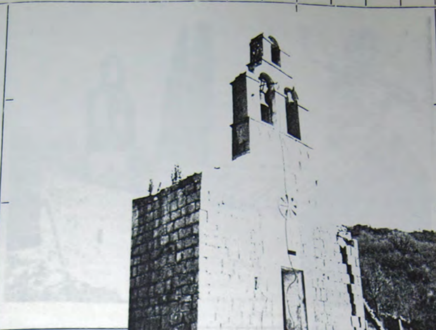
Pogled na crkvu sa sjeverozapada, zapadni

Regionalni zavod za ZAŠTITU SPOMENIKA KULTURE — KOTOR