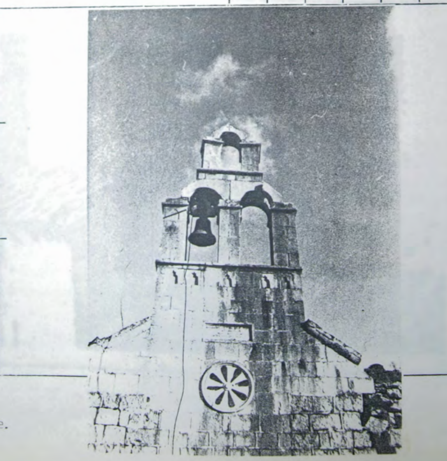
Zvonik na pročelju crkve.