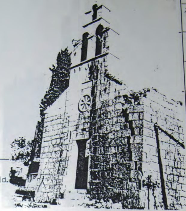
Поглед на цркву са југозапада, западни ѕид.

Regionalni zavod za ZAŠTITU СПОМЕНИКА КУЛТУРЕ — КОТОР